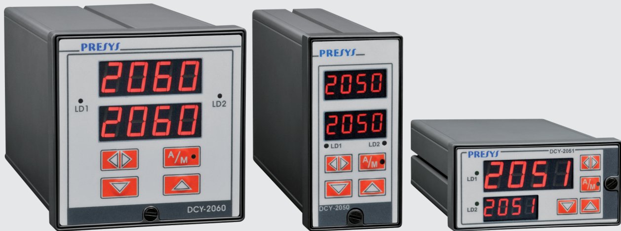
DCY-2060 / DCY-2060-F