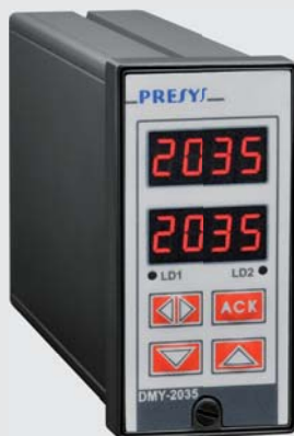
DMY-2035 / DMY-2035-F