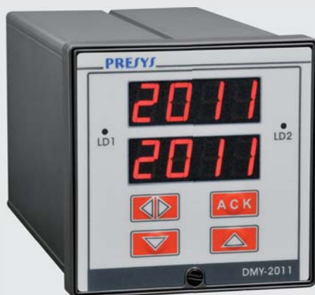
DMY-2011 / DMY-2011-F