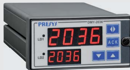
DMY-2036 / DMY-2036-F