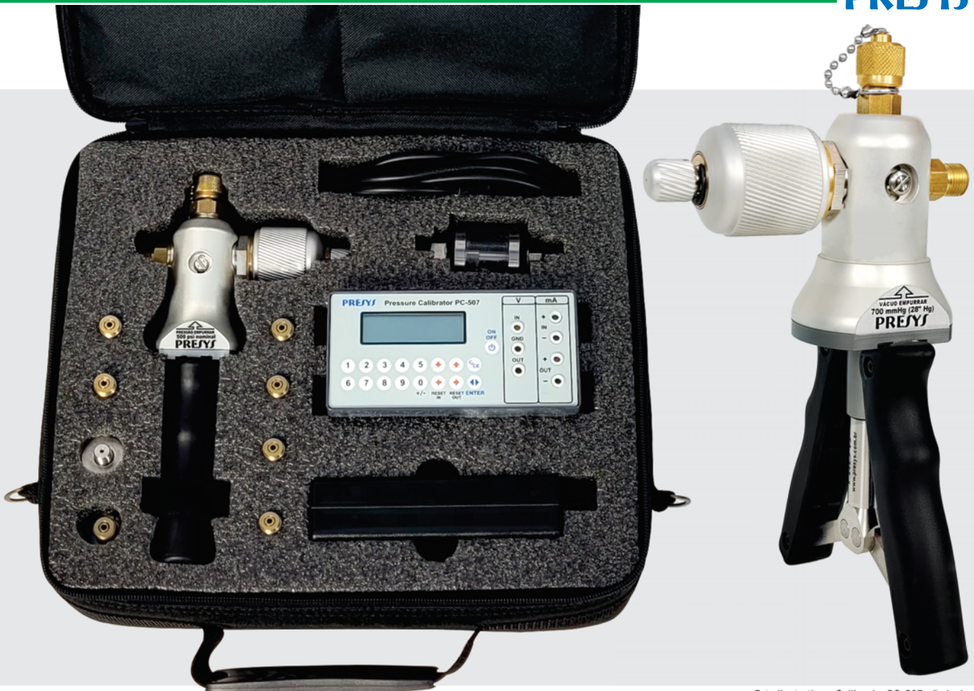
Foto Ilustrativa - Calibrador PC-507 não incluso.