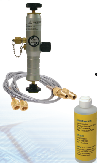
BY-8111-80 Pneumática Duplex para Baixa Pressão