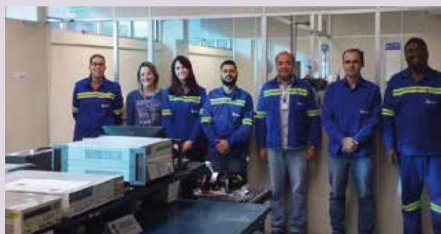
Equipe da CBA