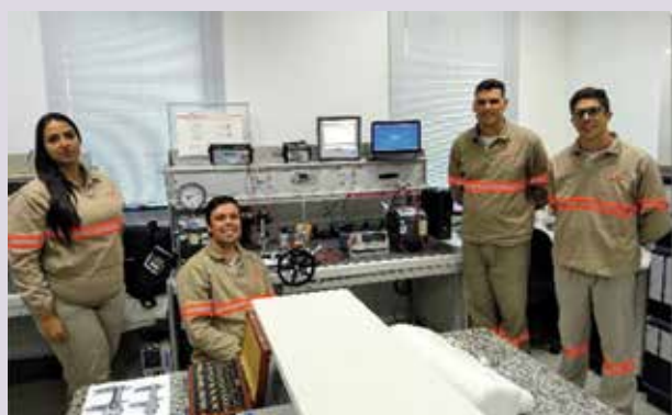
Equipe da Nissin